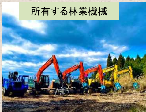
所有する林業機械