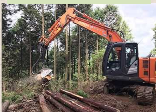
間伐作業(高性能林業機械)